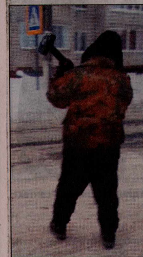
Молот приглянулся неизвестному мужчине.

было забирать молот у пьяного человека. Мало ли что могло произойти.